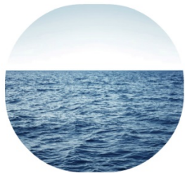
CPFL: Gestão de riscos hídricos