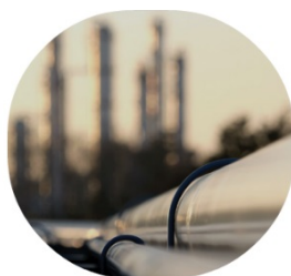
CEMIG: Uso do preço interno de carbono

Confira o relatório completo do que rolou!