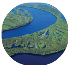
KLABIN: Gestão de capital natural